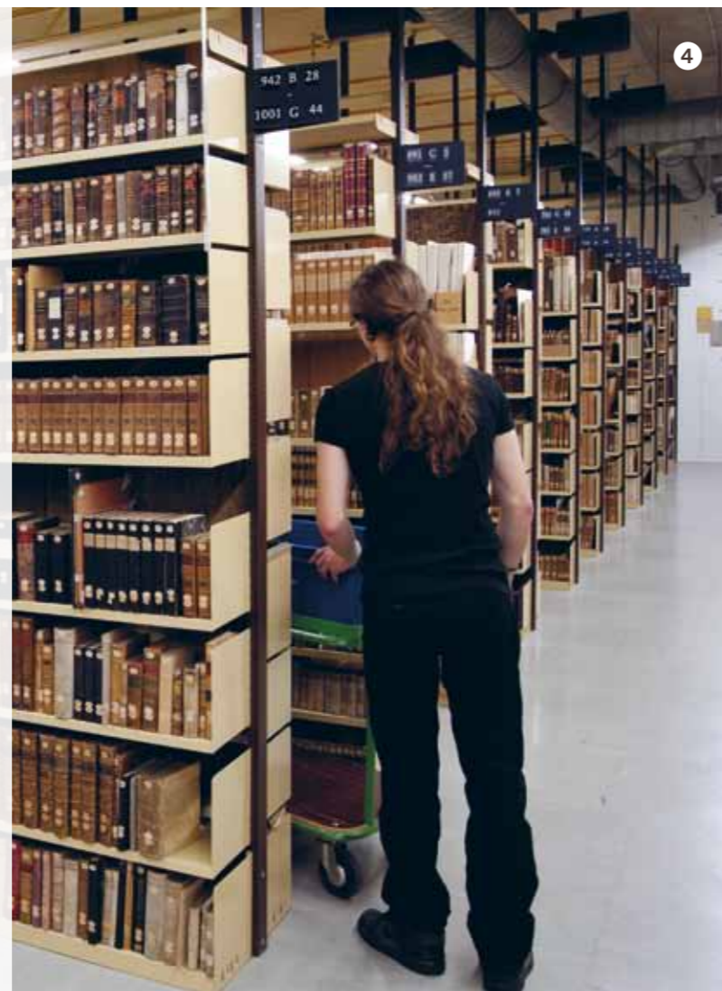
4 Magazijn van de KB.