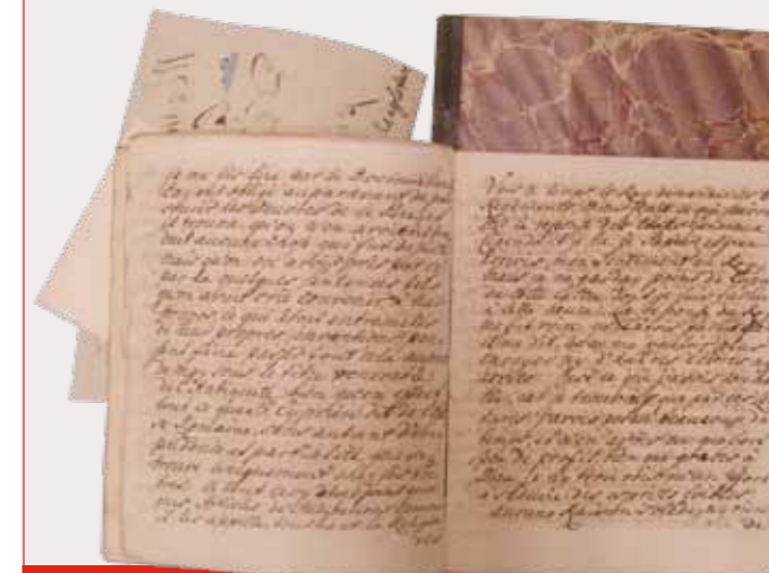
Verslag van een ontmoeting met de koning van Pruisen, uit het archief van Charlotte Sophie Gravin von Aldenburg Bentinck (1715-1800).

Voor projecten: www.metamorfoze.nl/projecten