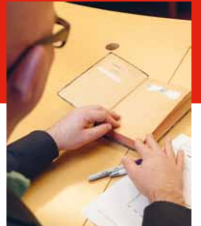
Het beoordelen van het papier (boek) tijdens de workshop ontzuren.

T ien boeken uit de negentiende eeuw liggen klaar om tijdens de workshop te worden beoordeeld. Gaan we deze boeken wel of niet ontzuren? We beginnen met de boeken goed te bekijken. Hoe bros en hoe zuur ziet het papier eruit? Voordat we de test uitvoeren maken we een inschatting. Vervolgens stellen we met de testpen vast of het papier wel of niet verzuurd is. Met de vouwtest bepalen we het vouwgetal (het aantal keren dat het vel papier kan worden dubbelgevouwen zonder te scheuren). Wat blijkt: we hadden de staat van de boeken veel slechter ingeschat dan ze in werkelijkheid zijn. Het uiterlijk van het papier zegt dus lang niet alles over de staat ervan.