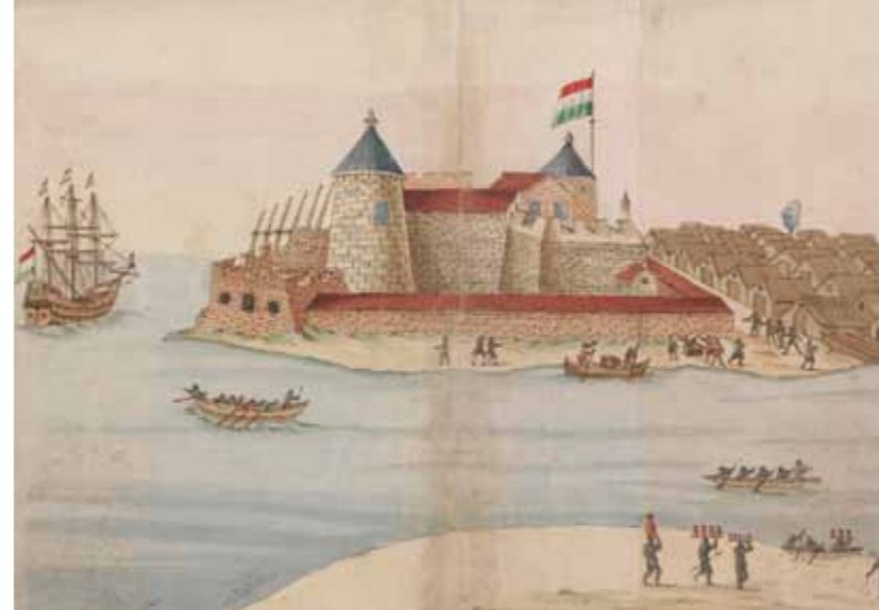
Kasteel Elmina, de zetel van de gouverneur van de Nederlandse bezittingen in Guinea en het centrum van de Nederlandse slavenhandel in West-Afrika.