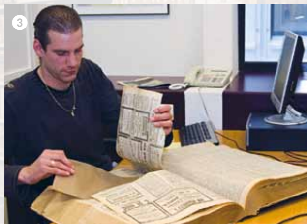
1-3 Repareren en voorbereiden van materiaal bij de KB.