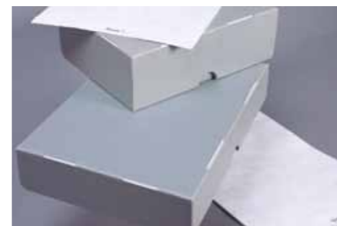
Doos en tyvezak