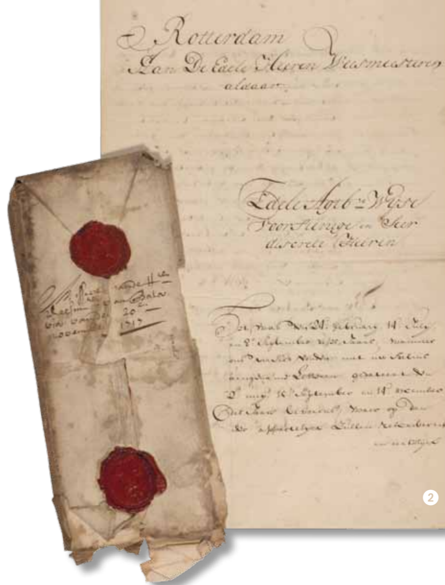
1 t/m 3. Een serie brieven en documenten uit Oost-Indië uit de periode 1714-1738.

In 2011 is het Metamorfoze project 'Weeskamer Rotterdam' van start gegaan. Het richt zich op het conserveren van het kwetsbare archief. Omdat het archief van de Weeskamer Rotterdam zo omvangrijk is (bijna 100 m) kan het binnen het project niet in zijn geheel worden geconserveerd. Er is daarom een keuze gemaakt voor de samenhangende series en de correspondentie met de Weeskamer Batavia uit de periode 1663-1833. Wel is van het gehele archief een schade-inventarisatie gemaakt en worden de niet-Metamorfozestukken behandeld door de afdeling Materieel Beheer van het Stadsarchief.