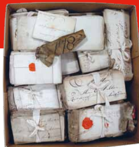
Doos met ongeopende brieven uit het Caraïbisch gebied, gekaapt tijdens de Vierde Engelse Oorlog.

Een apart middenkatern met korte bijdragen en fraaie illustraties toont de rijkdom en vari-