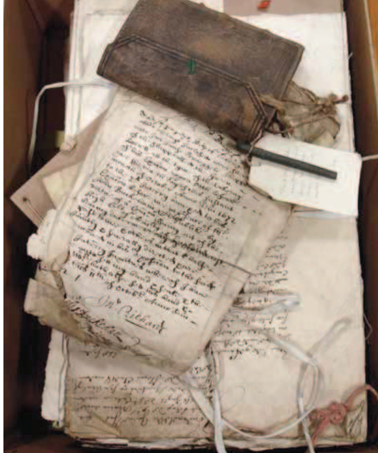
Doos Prize Papers met brieven en diverse soorten documenten en materialen, zoals een zakboekje met lei en griffel, gekaapt tijdens de Derde Engelse Oorlog (coll. TNA).

De zogenaamde Dutch Series in de National Archives of Guyana bestaan uit de archieven van het lokale Nederlandse bestuur