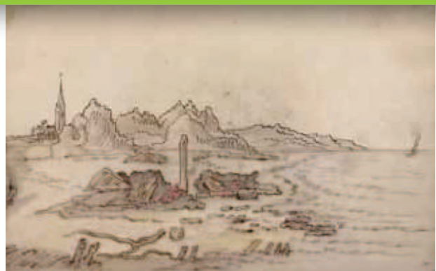
Tekening door Hendrik van Schuylenburg van de door een januaristorm op het strand van Domburg bloot gekomen altaren van de Romeinse godin Nehalennia, 1647 (coll. KZGW, ZB).

Met deze uitgangpunten in het achterhoofd is in 2014 op verzoek van Metamorfoze een rapport met analyse en aanbevelingen opgesteld door het bureau Raamwerk advies en tekst. De voornaamste aanbevelingen voor herinrichting van het traject Archieven en Collecties waren: zorg voor een aanvraag in twee stappen aan de hand van eenduidige formulieren, maak een beoordelingskader en stel een financieringsregeling op. Er is overgegaan op een fixed price per pagina waarvan de hoogte afhangt van de materiële staat en de complexiteit van het project, hetgeen in de praktijk neerkomt op ongeveer 100% financiering.