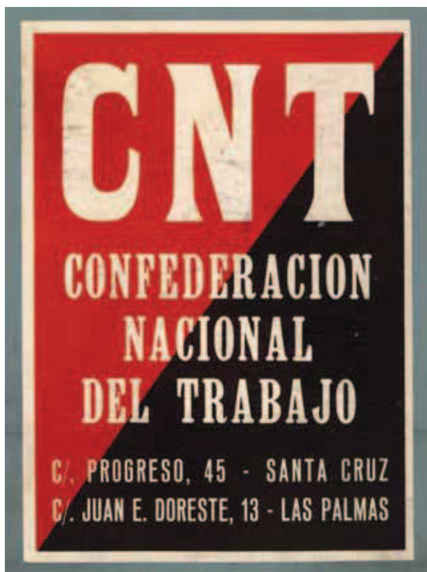
Affiche van de lokale afdeling van de vakbond CNT op de Canarische Eilanden, jaren 30.

H.A. Rauter was hoofd van de politieorganen van het Rijkscommissariaat. Hij was ook leider van de SS-organisatie in Nederland en een van de vier 'Generalkommissare' die onder Rijkscommissaris Seyss-Inquart het Duitse bestuur in bezet Nederland uitoefenden. Het omvat materiaal dat betrekking heeft op de Jodenvervolgving, met informatie over evacuatie, deportatie, vrijstelling en afstammingsonderzoeken.