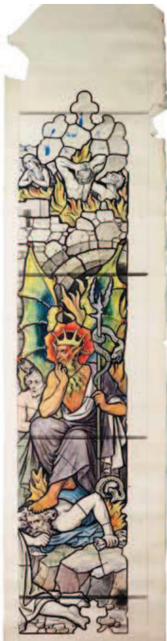
Karton voorstellende het Laatste Oordeel voor het kerkraam boven de uitgang van de O.L.V. ten Hemelopneming te Houten. Het meet 80 x 320 cm. en is getekend door Jos Stahl van het Glasbedrijf Nicolas, ca. 1919 (coll. SHCL).