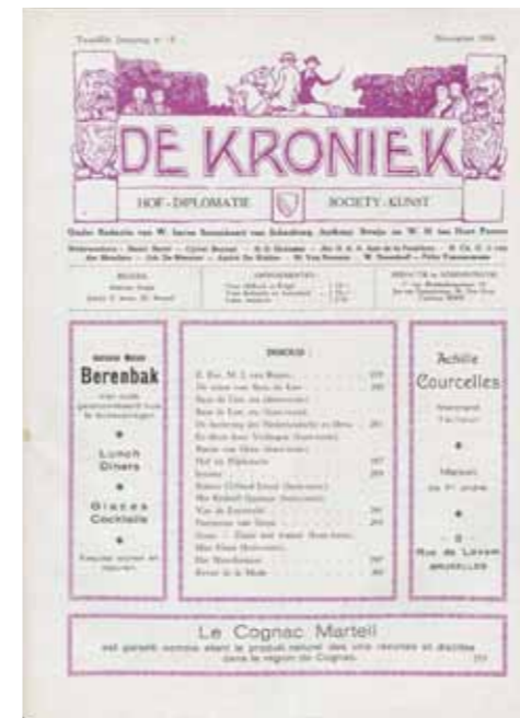
Voorbeelden van tijdschriften. Deze zijn al gedigitaliseerd en vindbaar op: tijdschriften.kb.nl