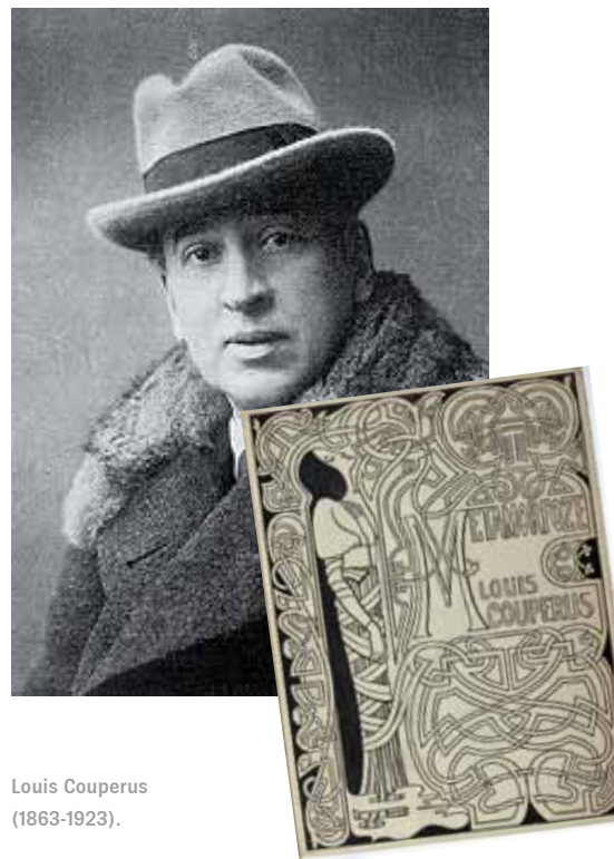
Louis Couperus (1863-1923).

Tot en met 25 augustus is in het Rijksmuseum van Oudheden in Leiden de tentoonstelling ' Couperus en de Oudheid ' te zien. De expositie combineert de vroege uitgaven van Couperus' romans (o.a. Antiek toerisme uit 1911) met archeologische voorwerpen uit de klassieke en Egyptische collectie van het