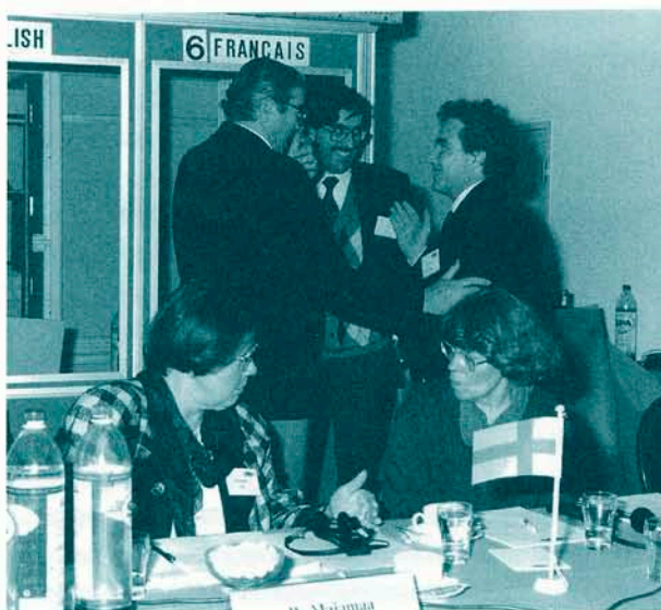
Een aantal deelnemers aan de European meeting on paper preservation.