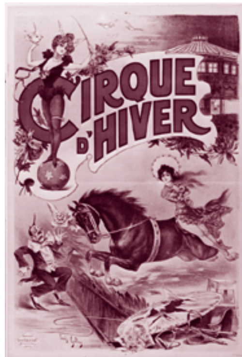
Nieuwe collecties. Uit: Marja Keyser. Het circus komt . Amsterdam, 1981 (Grafisch Nederland, 1981).

Er zal tevens gestart worden met de conservering van tijdschriften, waarbij de reeds geïnventariseerde geïllustreerde publikstijdschriften voorop zullen lopen. Het tijdschriftenproject, waaraan elders in deze nieuwsbrief een aparte bijdrage is gewijd, sluit wat betreft methodiek aan bij het recent uitgevoerde