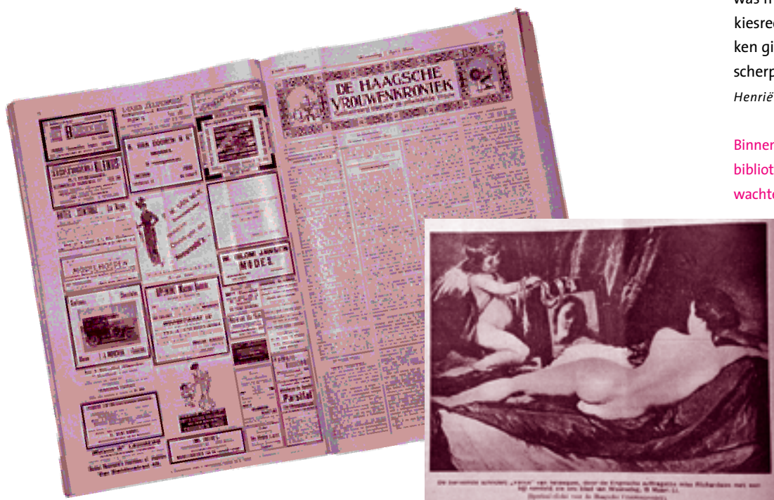
Links: De Haagsche vrouwenkroniek 2 (1914) 25 maart, p. 2.

Binnenkort kunnen de betrokken instellingen en bibliotheken een mailing van Metamorfoze verwachten over het project.