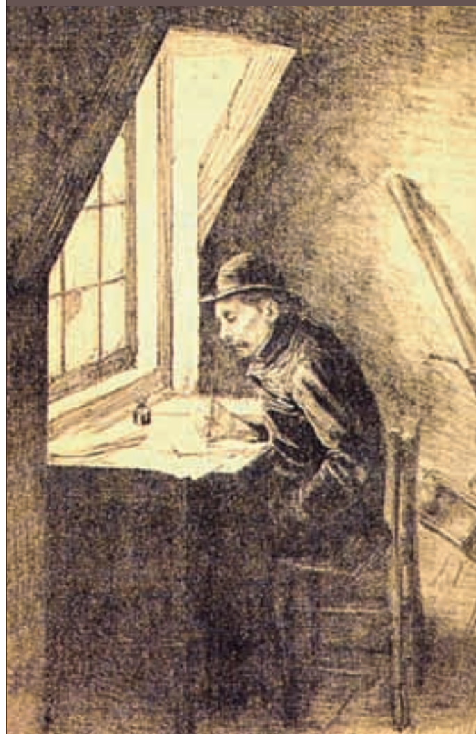
metamorfoze nieuws 03/06 213