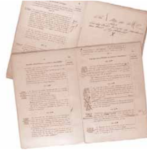
De collectie Zeeorders van het Instituut voor Maritieme Historie

Op het Instituut voor Maritieme Historie bevindt zich de zo compleet mogelijke collectie zeeorders. Deze dateren, het Recueil van See-saecken (1597-1744) buiten beschouwing latende, van 1671 tot vandaag. De Colleges ter Admiraliteit gaven extracten uit van de notulen van hun vergaderingen (besoignes). Deze extracten werden gebundeld meegegeven aan de oorlogsschepen. Regelmatig werden er nieuwe aan toegevoegd en werden verouderde extracten vervallen verklaard. Interessant en veelzeggend