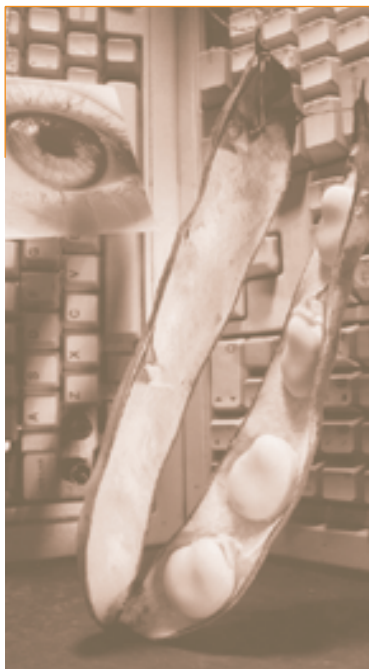
Uit: Rommert Boonstra, Metamorfozes: het theater van de communicatie . Den Haag, 2003.

Metamorfozes - het theater van de Communicatie , t/m 1 november 2004 Museum voor Communicatie Zeestraat 82, 2518 AD Den Haag 070 3307500, www.muscom.nl ma-vrij: 10.00-17.00, zat zon en feestdagen: 12.00-17.00