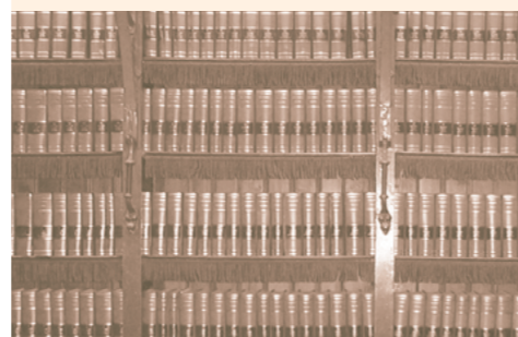
De 'Handelingenkamer' van de Bibliotheek van de Tweede Kamer.

de toekomst zoeken in alleen de Handelingen of de Kamerstukken en kunnen ze ook dossiers over bepaalde onderwerpen bestaande uit Handelingen , Kamerstukken en Kamervragen opvragen. Als laatste wordt het materiaal uitgebreid ontsloten. Niet alleen worden full-text zoekmogelijkheden toegevoegd en metagegevens zoals datum en titel, maar ook de Registers die per jaar zijn vervaardigd, worden gescand en ontsloten. Tot slot worden onderdelen van de tekst, zoals persoonsnamen, gemarkeerd in XML.