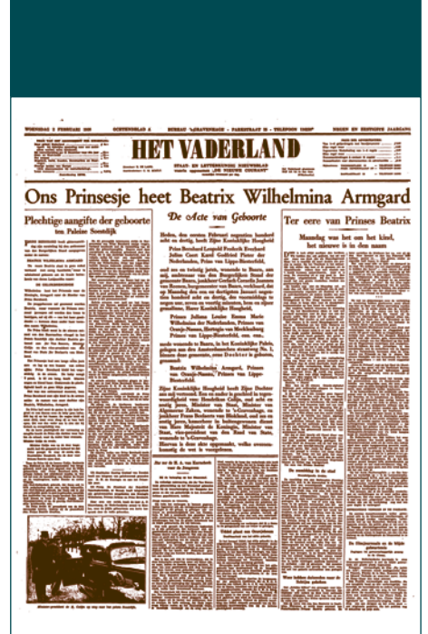
Aankondiging geboorte prinsesje Beatrix