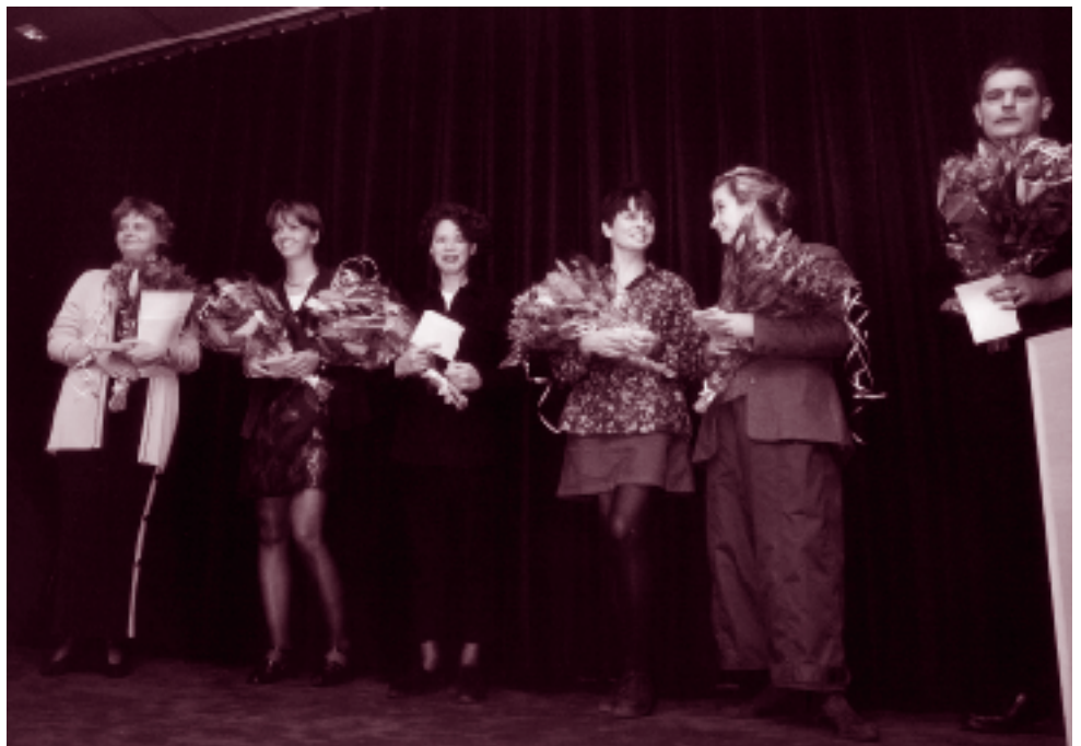
De prijswinnaars van de Victorine van Schaickprijzen