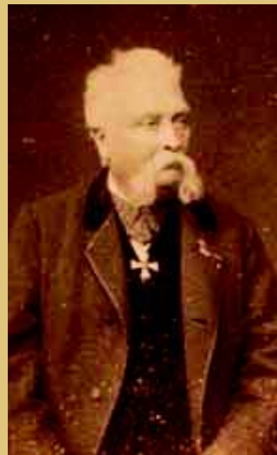
De een-na-laatste Nederlandse gouverneur in West-Afrika C.J.M. Nagtglas. Foto uit 1886 (coll. Zeeuws Archief, Historisch-Topografische Atlas Zelandia Illustrata, Koninklijk Zeeuwsch Genootschap der Wetenschappen).

Twee kleine particuliere collecties van Cornelis Johannes Marius Nagtglas (1814-1897) vormen bijzondere aanvullingen op het overheidsarchief Nederlandse Bezittingen Kust van Guinea. Om een goed beeld te krijgen van de Nederlandse bezittingen stuurde gouverneur Nagtglas zijn ambtenaren het land in om dorpen en stammen in kaart te brengen en informatie te verzamelen over het dagelijkse leven, handel, gewoonten, religies en ceremonies. Deze een-na-laatste gouverneur is na zijn pensionering door de regering aangezocht om de overdracht van de bezittingen aan Groot-Brittannië en het vertrek van Nederland uit West-Afrika voor te bereiden. Onder zijn bewind kwam er een uitruil van Nederlandse en Britse forten tot stand, die uiteindelijk leidde tot de overdracht van de Nederlandse bezittingen in West-Afrika aan Groot-Brittannië. Op 6 april 1872 werd de Nederlandse vlag voor de laatste maal gestreken op Fort Elmina. Voor de in de forten aanwezige voorraden hield Nederland nog een vergoeding van £3790 over. Daarbij gaf Engeland