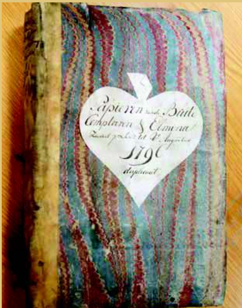
Onderweg naar Nederland door de Engelsen in 1803 gekaapt archief van de slavenforten in West-Afrika, dat zich nu in de Prize Papers in The National Archives in Kew bevindt (foto Erik van der Doe).

In The National Archives (TNA) in Kew nabij Londen bevindt zich ook Nederlands archiefmateriaal betreffende slavernij en slavenhandel. In het archief van het High Court of Admiralty is onlangs een deel van de administratie van de Nederlandse slavenforten op de Kust van Guinea uit de periode 1793-1803 ontdekt (circa 1,5 meter). Dit is onderweg van West-Afrika naar Nederland gekaapt door de Engelsen en vervolgens beland in het archief van de Britse admiraliteit in Londen. De in de