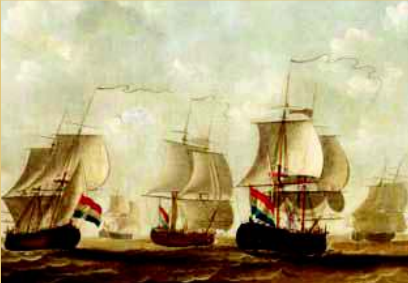
Schepen van de Middelburgse Commercie Compagnie, circa 1770. Schilderij (detail) door Engel Hoogerheyden (Stadhuiscollectie Middelburg).

>> bedrijfsvoering en de praktijk van de slavenhandel. Het in 2011 op het UNESCO Register Memory of the World geplaatste archief van de MCC is uniek, omdat hierin de administratie van een slavenhandelaar nagenoeg volledig aanwezig is. Dat maakt dit archief wereldwijd tot een bijzondere bron van gedetailleerde administratieve gegevens over de handel in slaven. In het kader van de herdenkingsjaren 2013 en 2014 publiceert het Zeeuws Archief in samenwerking met University College Roosevelt te Middelburg in een weblog een gehele slavenreis van een van de schepen van de MCC.