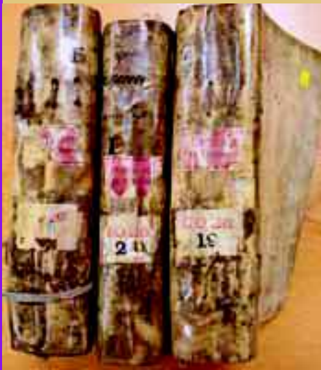
Ingekomen brieven uit Essequibo en Demerary, overgedragen aan Engeland in 1818 en nu in het archief Colonial Office in The National Archives in Kew.

>> archief over slavernij en slavenhandel. In het archief Colonial Office zit de in 1818 op verzoek van de Britse regering overgedragen bij de kamer Zeeland van de WIC ingekomen stukken uit Essequibo en Demerary (1686-1792; circa 6 meter), alsmede de in 1819 overgedragen onderdelen betreffende Berbice (1681-1795; circa 6 meter). Ook deze archivalia behoren naar hun aard te berusten in het Nationaal Archief. De stukken zijn reeds gesignaleerd en beschreven in 1961 door archivaris mevrouw Meilink-Roelofs van het Algemeen Rijksarchief. Nadat Groot-Brittannië in 1814 het beheer van de Nederlandse koloniën had overgenomen, verzochten zij om overdracht van de eerder in het gebied gevormde archieven. Na wat getreuzel werd daar aan gehoor gegeven. Voor de geschiedenis van de Nederlandse aanwezigheid in de kolonies Essequibo en Demerary is de serie ingekomen stukken bij de kamer Zeeland een van de belangrijkste en meest volledige bronnen. De kamer Zeeland was de eerstverantwoordelijke voor deze gebieden. De serie correspondentie in TNA is op de jaren 1690-1700 na compleet. De meegestuurde stukken bevatten onder andere plantage-inventarissen (inclusief overzichten van slaven en slavinnen, 'zwarte en rode slaven', ook indiaanse en creoolse slaven), lijsten van gevraagde en verhandelde goederen van en naar de West, processtukken, monsterrollen, financiële stukken en een aantal schetsen en