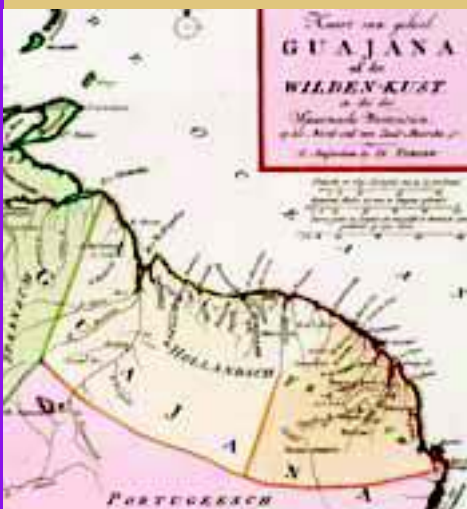
Kaart van de Wilde Kust met de kolonies Essequibo, Demerary en Berbice (detail), uit: 'Tegenwoordige Staat van America II' (1767).

verloren. Om het gebied niet aan de Fransen over te laten sloten enkele Amsterdamse kooplieden een nieuw akkoord met de WIC, waarbij werd overeengekomen tot het leveren van slaven door de compagnie en het betalen van recognitiegeld door de directie voor elk schip dat naar Berbice voer. Het aantal aangevoerde slaven was in verhouding tot andere Nederlandse koloniën groot. In 1763 kwam het tot een grote slavenopstand, met als voornaamste oorzaak de slechte behandeling van de slaven door verscheidene planters. Het klimaat was gunstig voor het uitbreken van moeilijkheden: een ziekte met veel slachtoffers, incidenten in het vorige jaar op plantages in Berbice en in hetzelfde jaar in het naburige Demerary, dreiging van vijandelijke indianen en een algehele apathie onder de blanken. Gezien de slechte financiële toestand van de WIC aan het einde van de 18e eeuw, besloten de Staten-Generaal in 1791 het octrooi niet langer te verlengen. Vier jaar later bepaalden zij dat de Sociëteit van Suriname en die van Berbice zouden ophouden te bestaan en dat het bestuur over deze kolonies aan de Staat zou overgaan. Het archief (32 meter) geeft een zeer gedetailleerd beeld van de wijze waarop de Nederlandse planterskolonie functioneerde, inclusief de rol die de slaven hierin speelden.