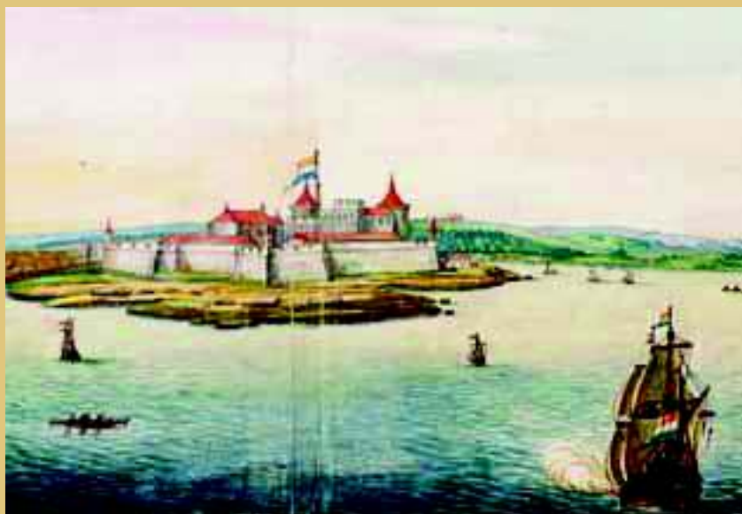
Fort Elmina in West-Afrika, halverwege de 17e eeuw. Tekening (detail) door Johannes Vingboons (coll. Nationaal Archief).

De in 1720 opgerichte Middelburgse Commercie Compagnie (MCC) richtte zich vanaf 1730 op de handel in slaven, toen deze was vrijgegeven door het aflopen van het octrooi van de WIC op West-Afrika. Gedurende de 18e eeuw was de MCC een van de belangrijkste Nederlandse slavenhandelaren. Na de afschaffing van de slavenhandel bleef de MCC bestaan als scheepswerf. Het archief (100 meter) omvat vooral de slavenhandelsactiviteiten. In totaal zijn er tussen 1732 en 1804 113 slavenreizen gemaakt, waarbij naar schatting 32.000 slaven van Afrika naar West-Indië zijn gebracht. Van bijna elke reis zijn journaal, monsterrol, soldijboek en cargaboek (in- en verkoop) bewaard, die tezamen een indringend beeld geven van de >>